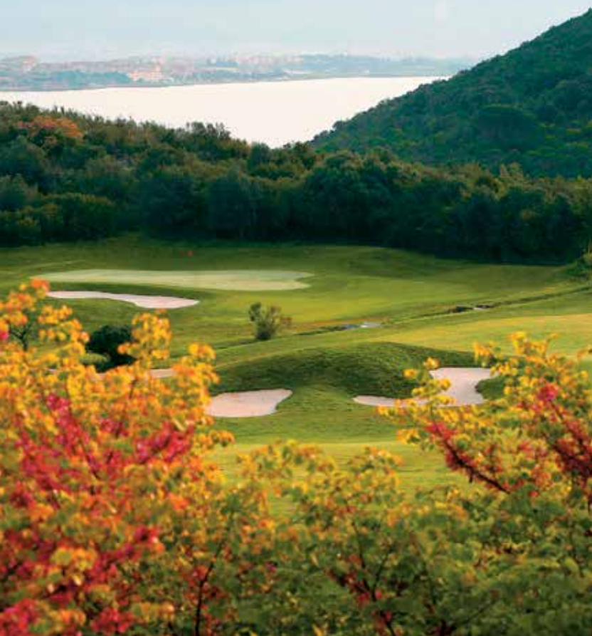
Argentario je velice romantický resort: k tomu patří i spousta květů a vůní od jara až do zimy

Celkovou obtížnost o něco zvyšuje vítr – nefouká pokaždé, ale údajně dost často, jak naznačil Ottavio Coppola. To by nebylo tak zlé. Dalším faktorem je vedro. Ale i když je na prostranství u hotelu na padnutí, u klubovny je to lepší a na hřišti, zvláště pokud použijete buginu, o vedru přemýšlet nemusíte. Bunkerů je spousta; sice jsou vidět z dálky, ale při pohledech z výšky špatně odhadujete, jak jsou daleko, takže informace z birdie booku nebo obrázků na odpalištích přijdou vhod.