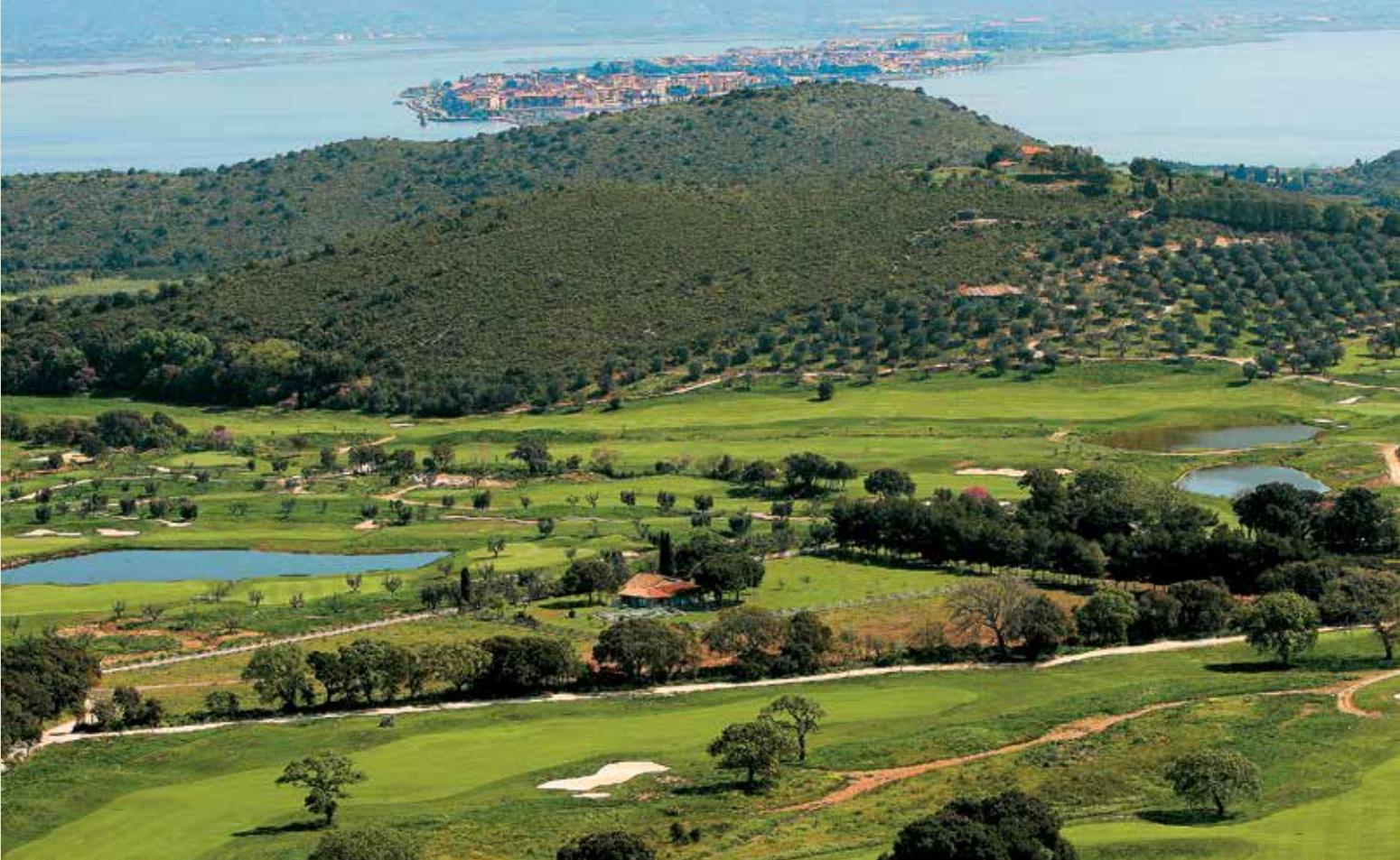
Tenhle pohled běžný smrtelník neuvidí, ledaže by se rozhodl vyškrábat se kus do úbočí Monte Argentario