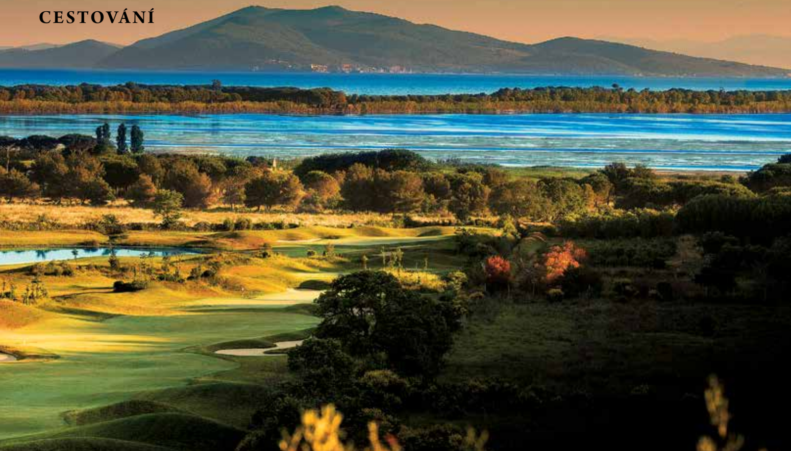
Na golfu se nejlíp fotí těsně po východu slunce: tady to platí dvojnásob. Za pár chvil pak lehký opar všechny barvy ztlumí