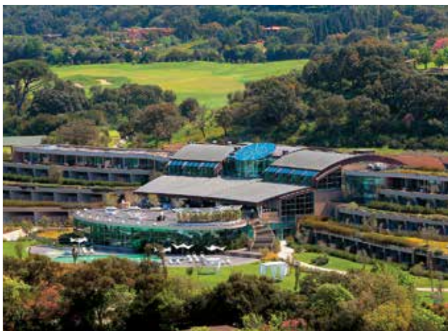
Uvnitř designově velmi promyšlený, zvenku nijak okatý resort. Tak to má být...

Místní klub má na tři stovky členů, někteří jsou z větších vzdáleností, od Říma, který je asi 200 km odtud, až po Florencii, ta je přibližně stejně daleko. Ale pověst klubu coby nej-